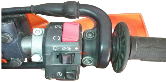
Gehäuse 1 )