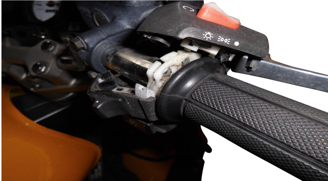
Abbildung 1: Keine original Abbildung

Die Anbauanleitung bleibt solange gueltig, bis sich auf die Umruestung bezogenen Vorschriften aendern oder die Fahrzeuge Aenderungen aufweisen , die die beschriebene Umruestung beeinflussen oder Ihre Verifizierung / Zertifizierung die Gueltigkeit verliert .